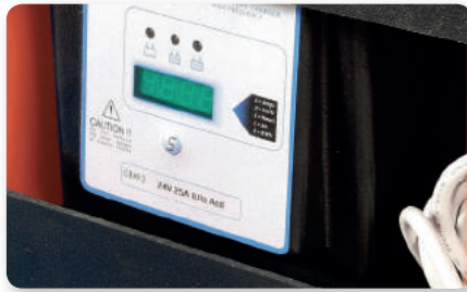
Carica batterie on board On-board battery charging Cargador de batería incorporado