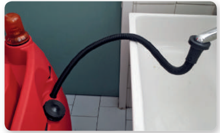
Tubo riempimento serbatoio Solutions filling hose Manguera llenado deposito