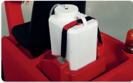
Dosatore detergente on board On board detergent dosing system Dosificación detergente a bordo