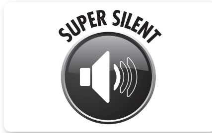
Motore aspirazione insonorizzato Noise-reduced vacuum motor Motor de aspiración silenciado