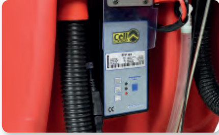
Carica batterie on board On-board battery charger Cargador de batería incorporado