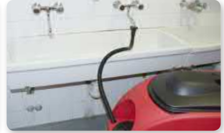
Tubo riempimento serbatoio Solution filling hose Manguera