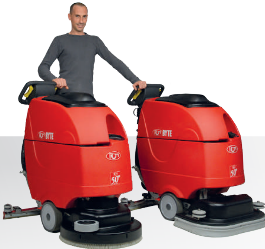
BYTE II 531T